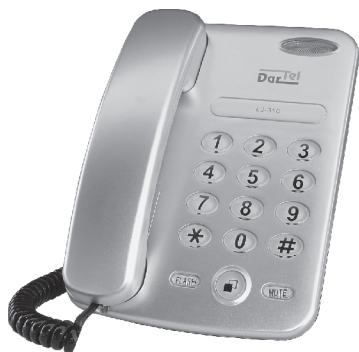
Model: LJ-310 Telefon sznurowy